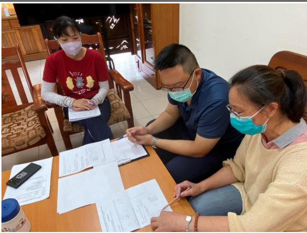
說明:於校長室進行備課會議