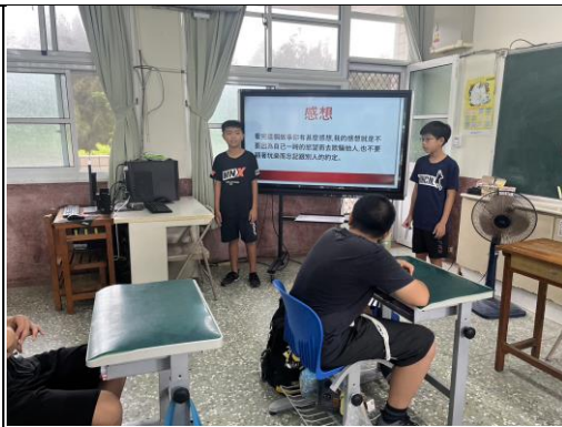
用自己的話表示誠信在生活中的重要及感想