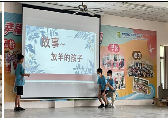
在朝會中，用故事及表演方式呈現簡報內容