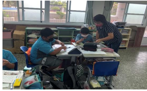
說明：課堂間操作指導-分段實作