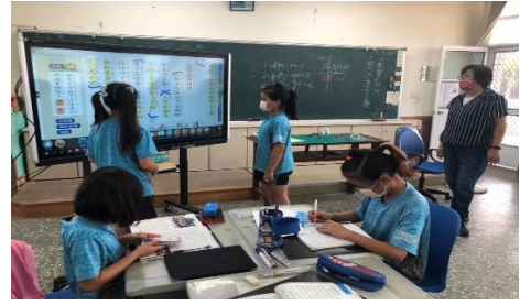
說明：學生操作指導-擷取大意