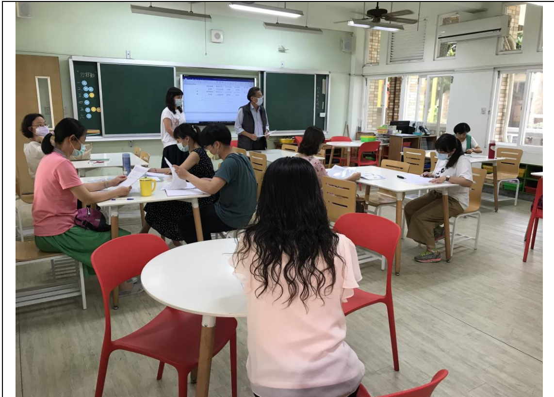
校長及教務主任偕同主持。