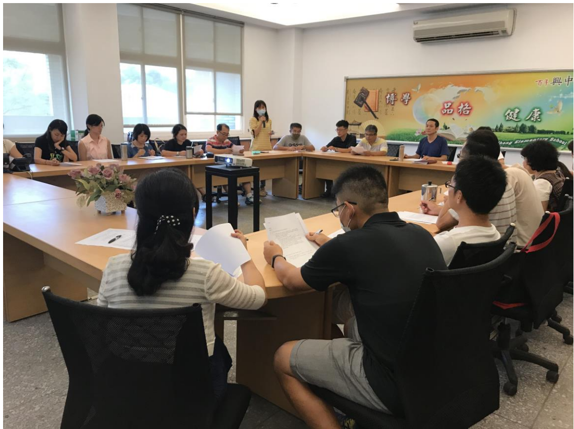
課發會委員含行政代表、領域代表及學年代表。