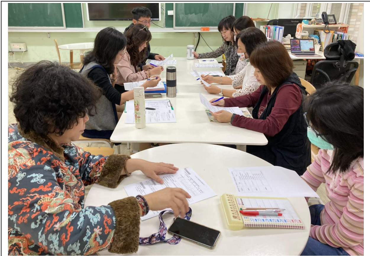
宏啟主任主持課發會。