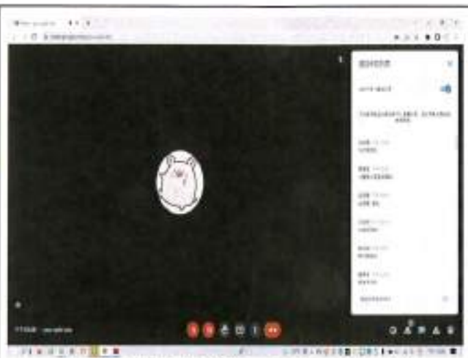
委員們陸續上線參與開會並同意各案由