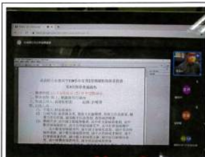
於6月21日召開線上課發會，審查課程計畫之總體架構、部定課程計畫、課程評鑑報告等案由