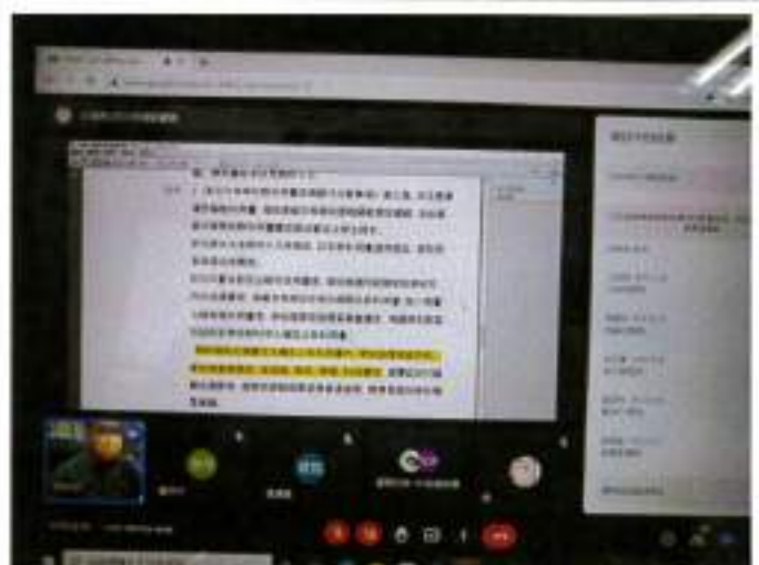
針對上次未議決高中英文教科書版本一案，請英文領召進行說明，再讓委員決議。