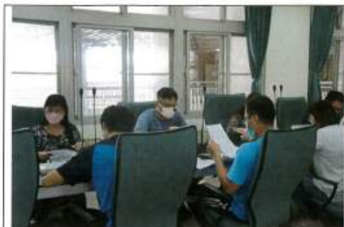
體育組長報告體育班學分修改狀況