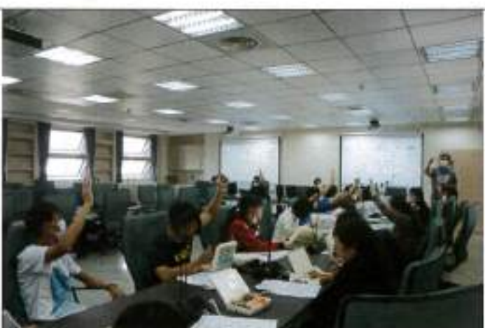
委員針對案由予以投票