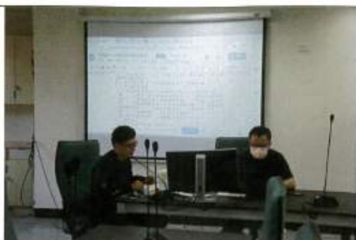
實研組長報告學分修改細項