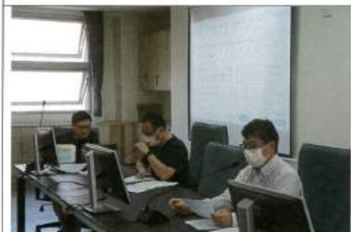
校長主持會議，邀請教務主任回答委員提問