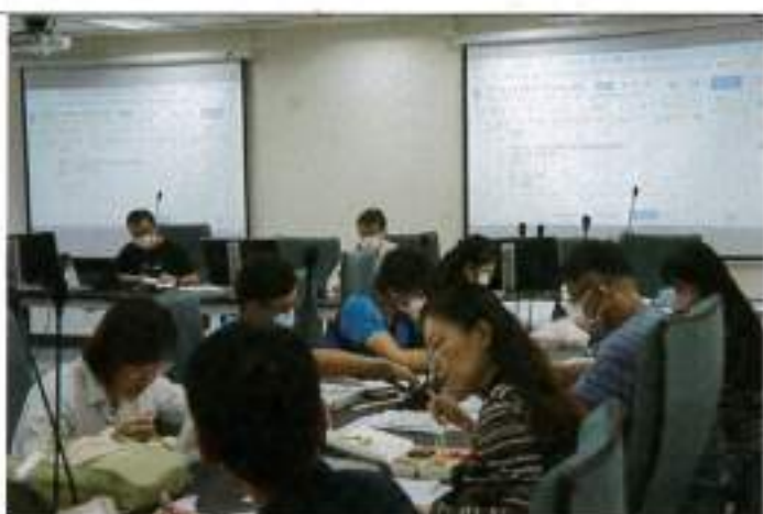
委員們仔細審閱會議資料