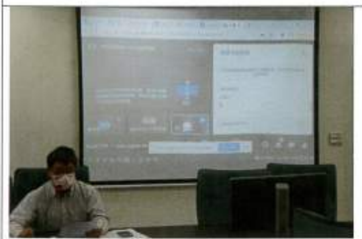
專家學者透過線上，指導本校課程計畫修改意見