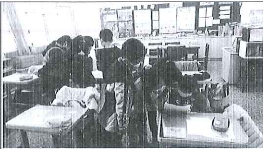
學生分組發表前準備