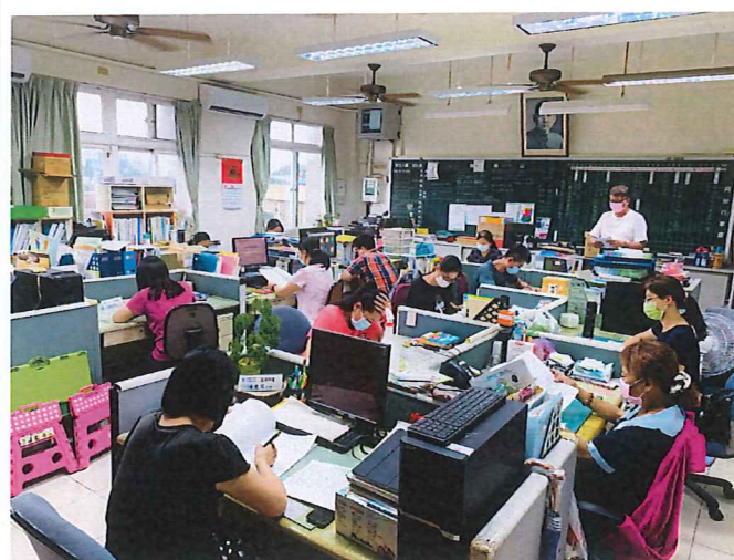
說明：一一一學年度課程計畫討論