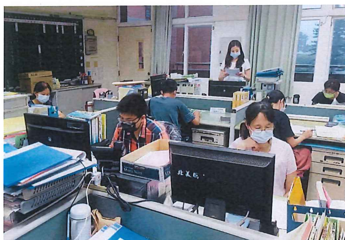
說明：一一一學年度課程計畫討論