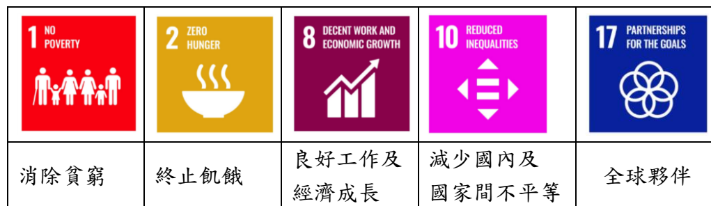
表一：課程探究方向：

三、課程設計理念：身處於一個在地化與全球化並行的世代，能具備理性溝通、分享互動以及團隊合作的能力，將更能調適及面對多元文化的衝擊。本課程選擇SDGs其中五個全球議題(表一)為課程主軸，希望藉由國際移工與移民課題，讓學生認識移工和新住民在台灣的現況，瞭解未來跨國移動工作或移民的普遍性下，當自己日後面對跨國移工或移民生涯規劃時，能具有同理態度與應變能力。本課程希望學生學習後，能培養對於多元族群、社會、國家及世界的關懷以及全球永續的責任意識，並期望能透過分組討論的過程中，激發主動探索學習的動力，培育終身學習的公民素養。