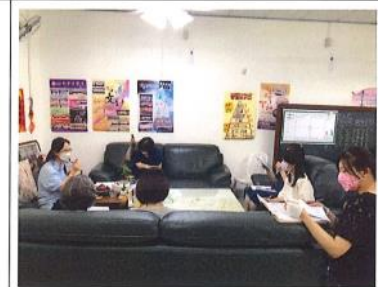
110 學年美術課程實施狀況討論