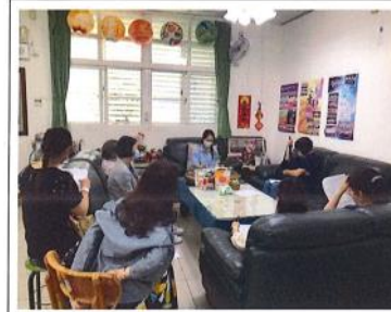
業務報告：本年實施狀況與活動期程