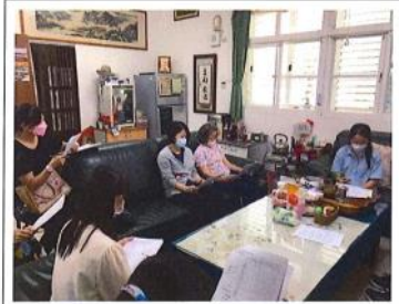
111 學年國樂課程計畫審議