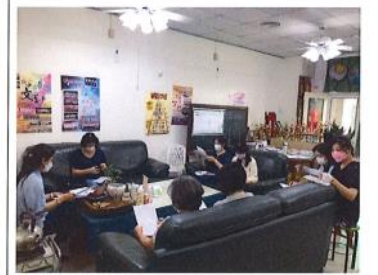
111 學年美術課程計畫審議