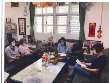
110 學年國樂課程實施狀況討論