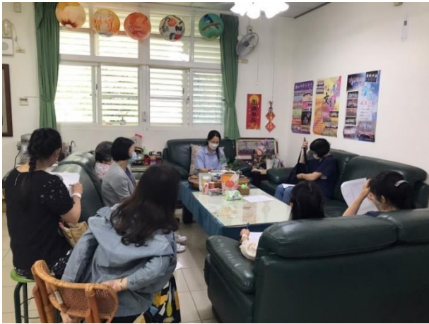
業務報告:本年實施狀況與活動期程