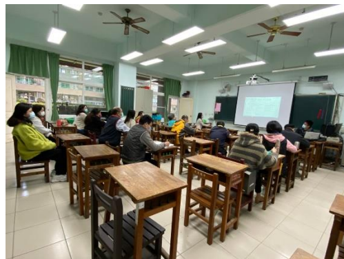
說明:提案討論說明二