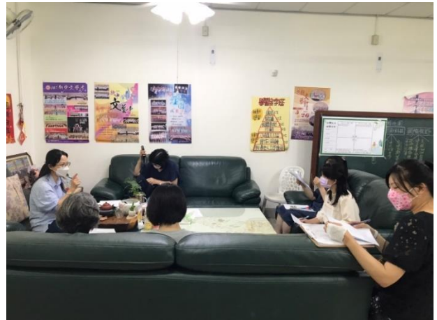
110學年美術課程實施狀況討論