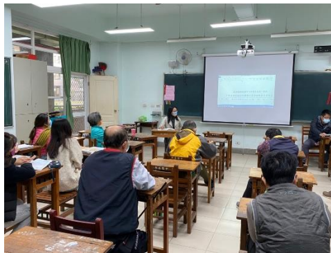
說明:提案討論說明一