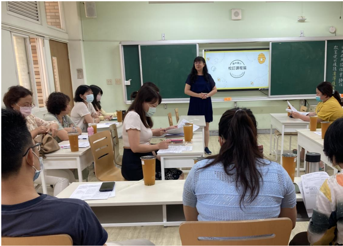
教務主任針對校訂課程未通過校訂課程做說明。