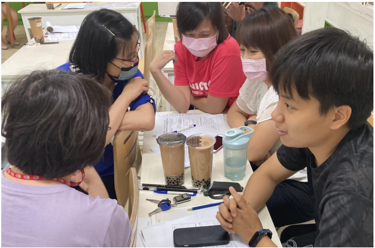
課發會委員審議部定課程計畫。