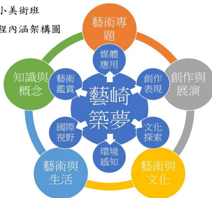
竹崎國小美術班 藝術課程內涵架構圖

結合竹崎國小「築夢以一己兒童」之兒童願景發展出本校美術班之藝術課程內涵架構圖-願景為「藝崎築夢」，包含六個學習面向：創作表現、文化探索、環境感知、國際視野、藝術鑑賞、媒體應用。在三到六年級的美術班課程單元裡皆會包含此六大學習面向，內容逐年加深加廣，三年級以生活周遭之環境為探索主題、四年級涵蓋在竹崎鄉社區之探索、五年級則延伸至整個台灣、六年級內容則銜接到國際探索。