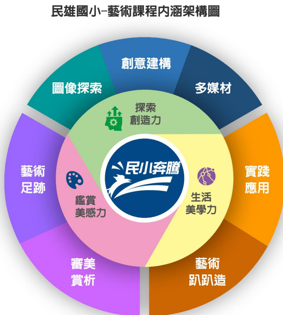
圖一：藝術課程內涵架構圖