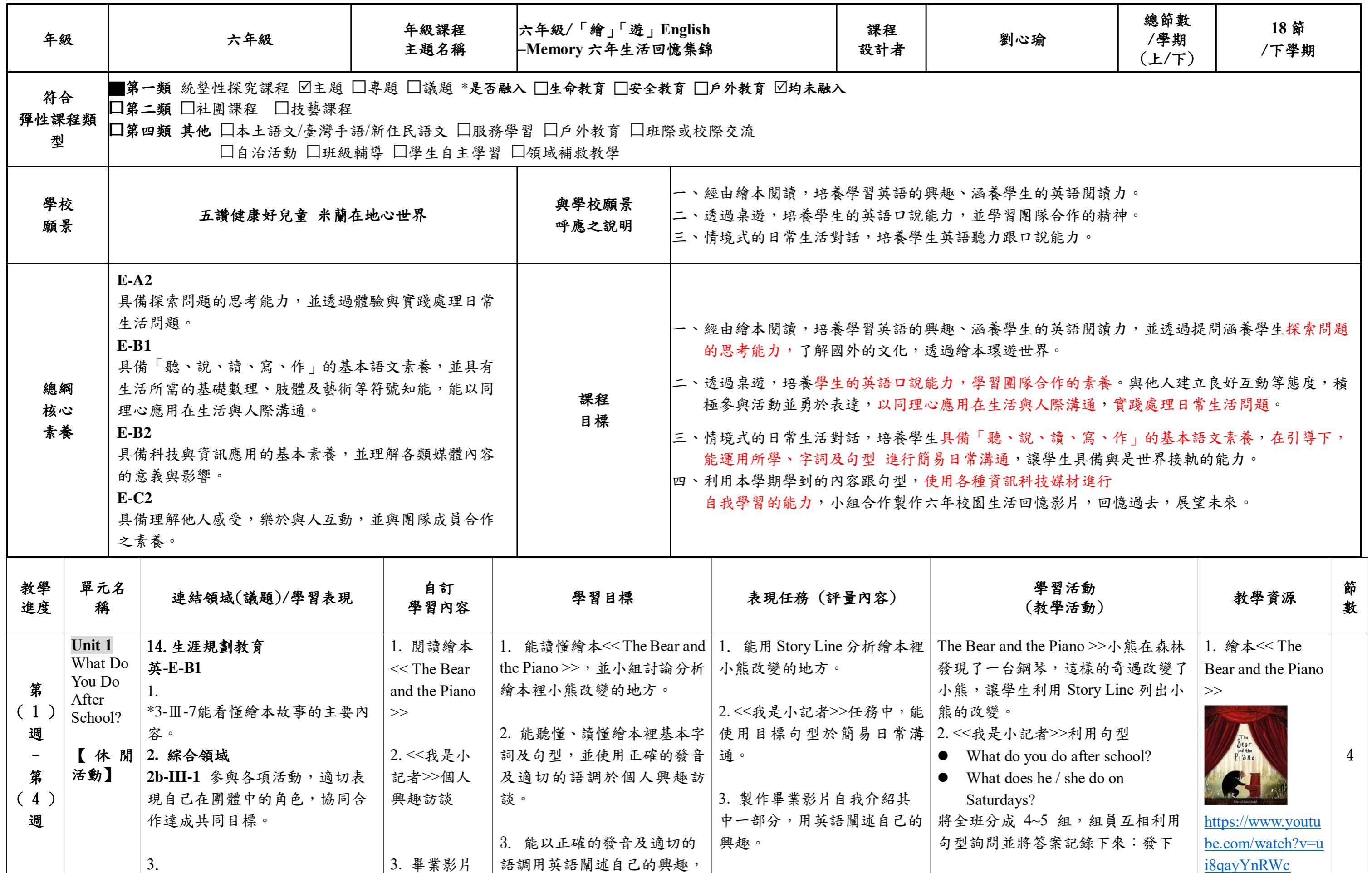
嘉義縣 三和國小 113 學年度校訂課程教學內容規劃表(表 11-3)