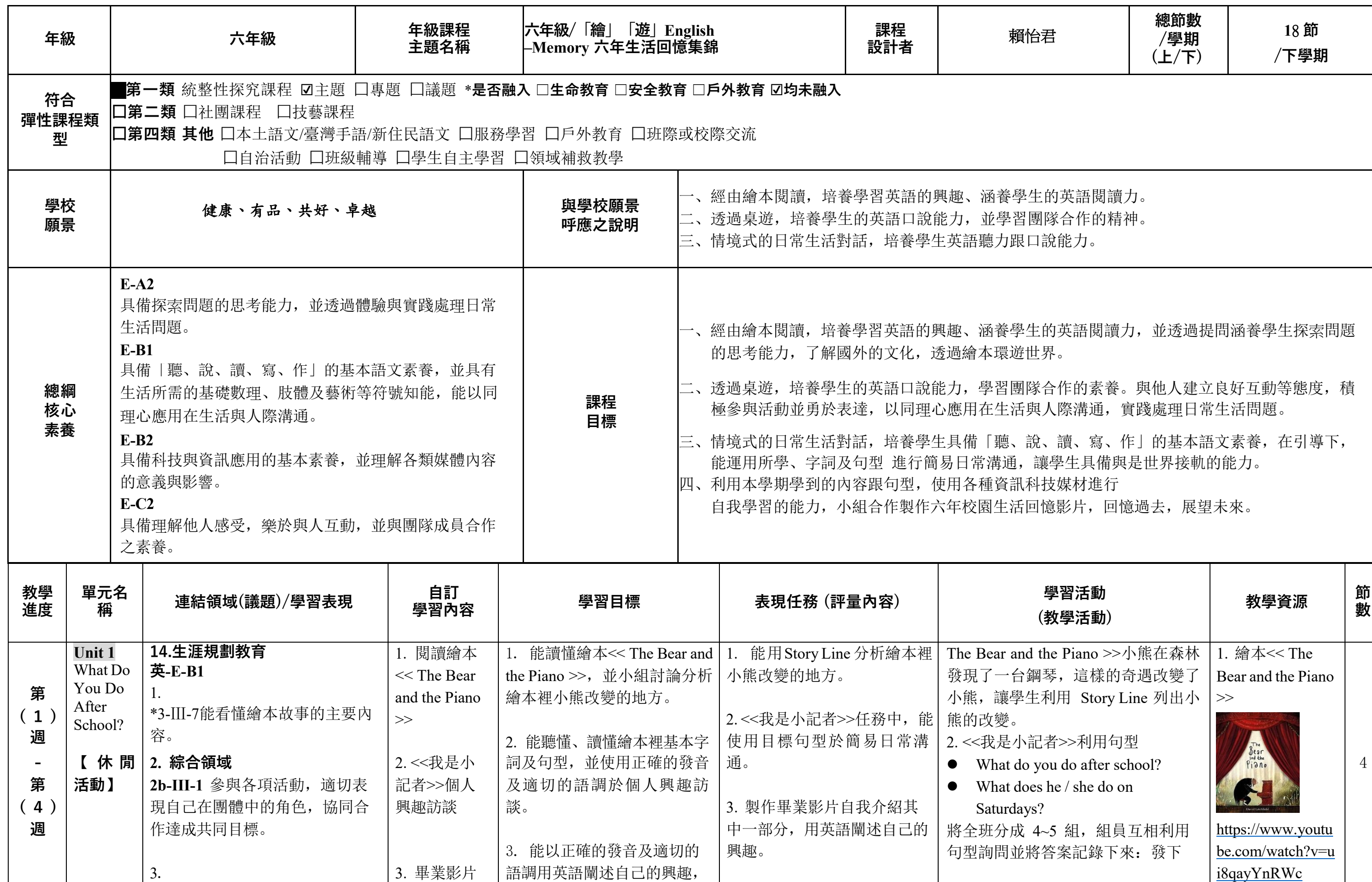
嘉義縣 圓崇國小 113 學年度校訂課程教學內容規劃表