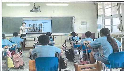
老師針對報導做總結補充