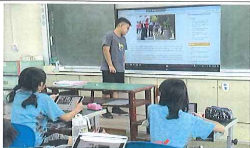
學生上台發表報導文章重點