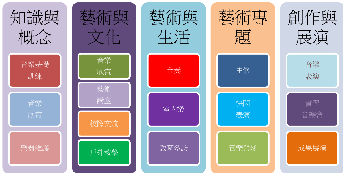
管樂藝才班課程架構表與教材